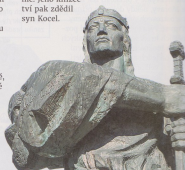
Socha knížete Pribiny v Nitrze

k obléhání? Nebo snad sebevědomě vytáhl s vlastním vojskem proti Mojmirovi? Tato varianta asi nebude příliš pravděpodobná, protože měl málo času, nedostatečnou hotovost a zbavil by se strategické výhody za hradbami Nitry. Ostatně, o pevně zdi velkomoravských hradišť se v blízké budoucnosti třáslí i síly Franků. Ať už tedy pod tíhou obléhání, nebo dobrovolně, Pribina opustil Nitranské knížectví, které bylo rokem 833 definitivně připojeno k Moravě. Takto povstala Velkomoravská říše.